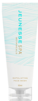
JEUNESSE SPA BOTANICALS® EXFOLIATING FACE WASH 50ml