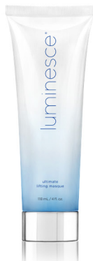
LUMINESCE® ULTIMATE LIFTING MASQUE 118 ml