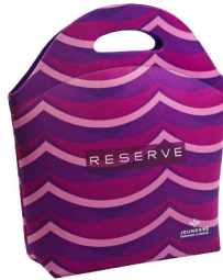
LANCHEIRA RESERVE® Dimensões A28xL01x26cm