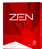
ZEN FIT® FRUIT PUNCH 30 sachês por caixa