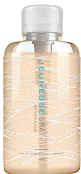
JEUNESSE SPA BOTANICALS® BODY OIL 130ml