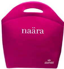
LANCHEIRA NAÄRA® Dimensões A28xL01x26cm