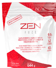
ZEN FUZE® VANILLA BLISS - PEQUENO 644g