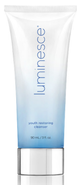
LUMINESCE® YOUTH RESTORING CLEANSER 30 ml