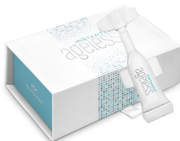
INSTANTLY AGELESS® 25 sachês por caixa