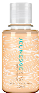
JEUNESSE SPA BOTANICALS® MICELLAR CLEANSER 100ml