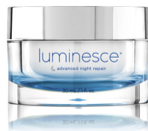
LUMINESCE® ADVANCED NIGHT REPAIR 30 ml