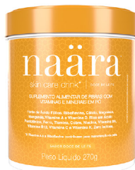
NAÄRA® DOCE DE LEITE 270g