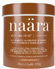
NAÄRA® CHOCOLATE 270g