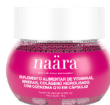
NAÄRA® HAIR AND NAILS 30 cápsulas