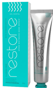
RESTORE® SPEED WHITENING NANO REPAIR 90g