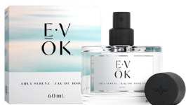
E-VÔK® AQUA SERENE 60ml