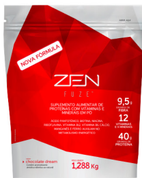
ZEN FUZE® CHOCOLATE DREAM 1.288kg