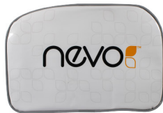
COOLER NEVO® Dimensões A10x23xC35cm