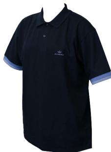
POLO MASC JEUNESSE® Tamanhos: P, M, G e GG