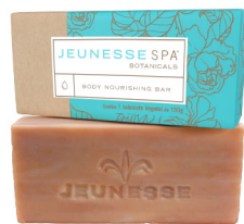
JEUNESSE SPA BOTANICALS® BODY NOURISHING BAR 150g