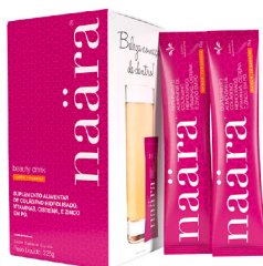
NAÄRA® TANGERINA STICK 15 sachês (225g)