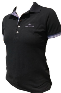
POLO FEM JEUNESSE® Tamanhos: P, M e G