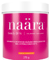
NAÄRA® TANGERINA 270g