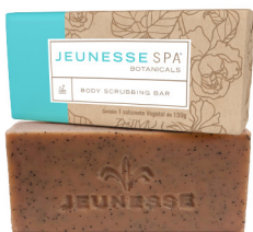
JEUNESSE SPA BOTANICALS® BODY SCRUBBING BAR 150g