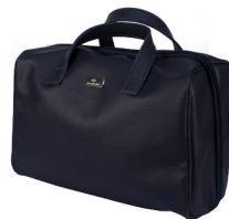
NECESSAIRE JEUNESSE® GRANDE Dimensões A15xL4xC25cm