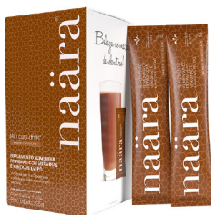
NAÄRA® CHOCOLATE STICK 15 sachês (225g)