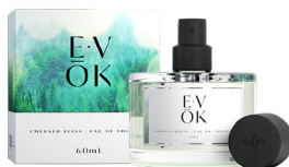
E-VÔK® EMERALD BLISS 60ml