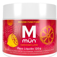
(M) MÜN® 120g