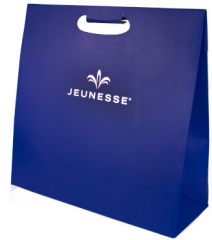
GIFT BAG JEUNESSE® Dimensões A32xL1mmxC33cm