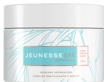
JEUNESSE SPA BOTANICALS® DEEP REPAIR MASK 250 ml