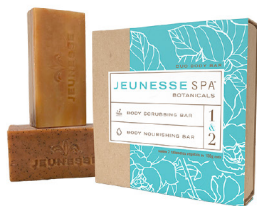
JEUNESSE SPA BOTANICALS® BODY BAR DUO 150g (cada)