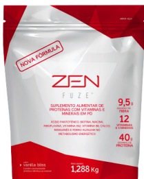
ZEN FUZE® VANILLA BLISS 1.288kg