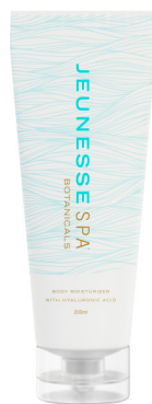
JEUNESSE SPA BOTANICALS® BODY MOISTURIZER 200ml