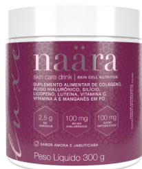
NAÄRA® LUXE AMORA E JABUTICABA 300g