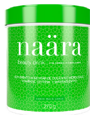
NAÄRA® MAÇA VERDE 270g