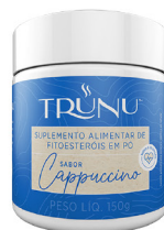
TRUNU® CAPPUCCINO 150g