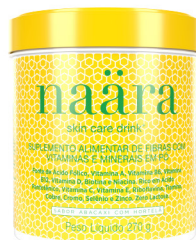
NAÄRA® ABACAXI COM HORTELÃ 270g